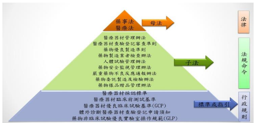
圖： 醫療器材 管理法規 依據