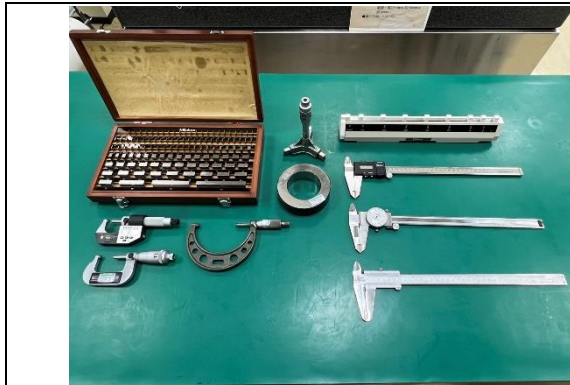
手工量具(卡尺/分厘卡)