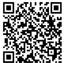
線上報名 QR 碼

於 11/23 前 報名繳費加送「未來，你在哪裡？：掌握產業趨勢，領先你的未來」作者簽名書